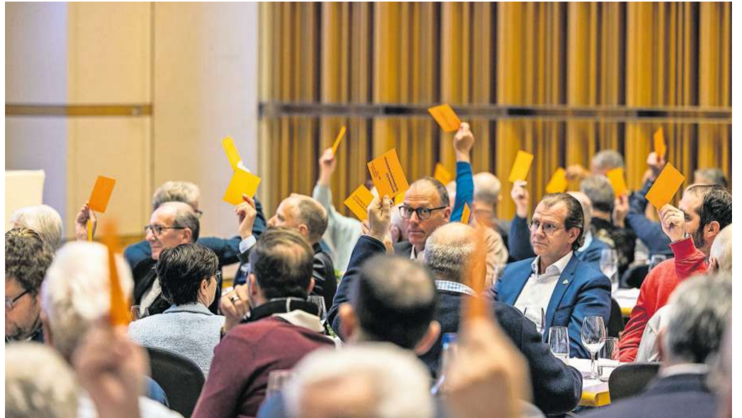
Die GBC-Genossenschafter heissen an der GV den Neubau eines Pavillons gut.

Neben den Wahlen und der Ersatzwahl erfuhren die zahlreich erschienenen Genossenschafterinnen und Genos-